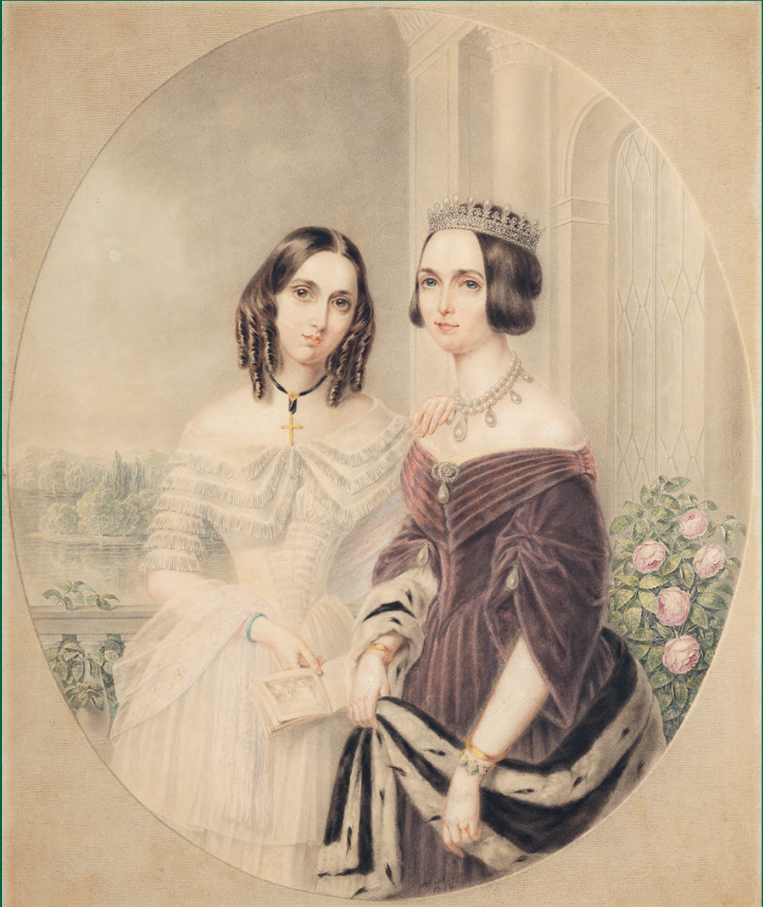
Joséphine och Eugénie stod varandra nära genom livet, förenade bland annat i sin kristna tro, Eugénie lågkyrklig lutheran, aldrig påverkad av sin katolska mor. På Maria Röhl's teckning i akvarell och krita från 1846 kunde man nästan ta mor och dotter för systrar, om man inte visste bättre.