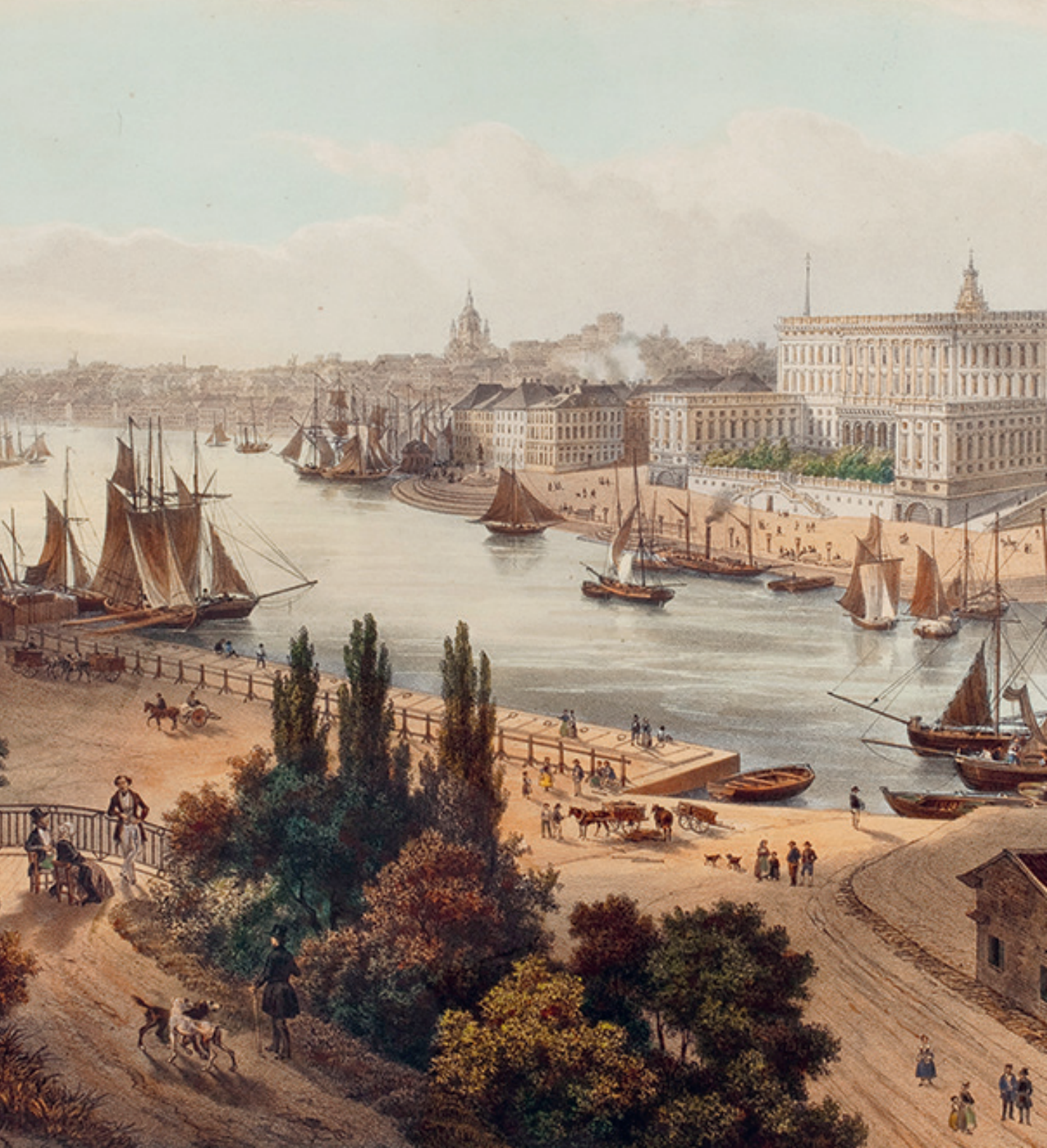
Utsikt från Fersenska terrassen mot Slottet, Skeppsbron och Skeppsholmen. Kolorerad litografi efter en målning av Johan Henric Strömer, 1840-tal.