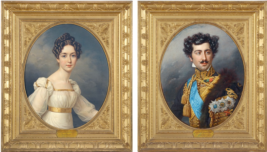
Joséphine och Oscar, avporträtterade bröllopsåret 1823 av Joseph Stieler.

Föregående uppslag: På Per Krafft d.y:s stora målning av bröllopsceremonin i Storkyrkan bär Oscar stövlar i blått, inte silverfärgade. Det troliga är att blå stövlar fanns i Oscars garderob från 1817 och användes vid faderns kröning 1818. Kanske kom det ett påpekande uppifrån till Krafft att det skulle vara blå stövlar på målningen – för att understryka för eftervärlden att Oscar vid tillfället »bara« var kronprins. Jag vet inte, jag spekulerar.