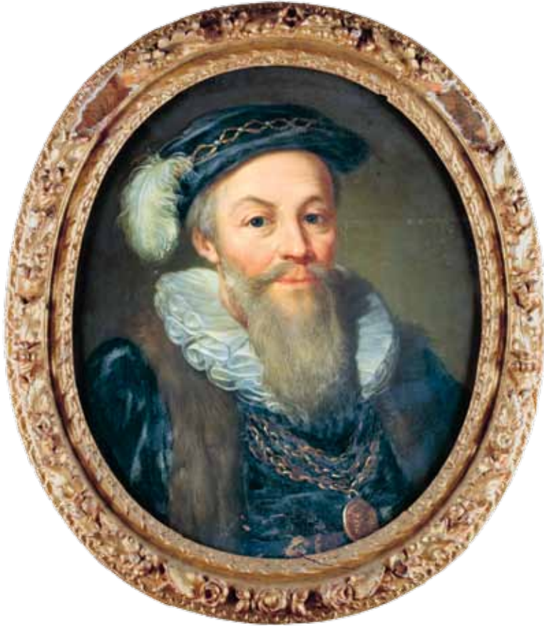
Erik Johansson (Vasa), Gustav Vasas far, målad av Lorens Pasch 250 år senare, då Gustav Vasa gjordes populär i Gustav III:s opera. Verklighetens Erik Johansson var riksråd och en hänsynslös herre.

delsstäder med kontakter över hela Europa och handelsförbindelser med de första kolonierna i andra världsdelar. Men de senaste åren hade Danmark alltmer visat ambitioner att göra slut på Hansans monopol på Östersjöhandeln och göra Köpenhamn till den ledande handelsstaden. Alltså låg det i Lübeck's intresse att stödja svenskarnas kamp mot Danmark och på så sätt splittra den nordiska unionen.