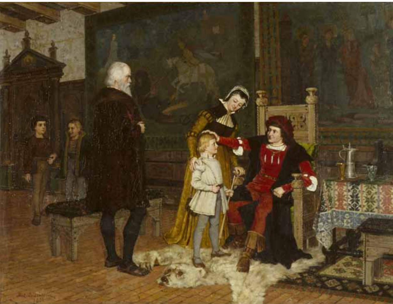
Det sägs att den unge Gustav Eriksson (Vasa) mötte unionskungen Hans i Stockholm och att kungen förutspådde gossen en ljus framtid. Målning av J. A. G. Acke.

kammarherre och själv upplevt synden och skörlevnaden i Vatikanen. Den unge kammarherren Gadh sägs också ha haft egna konkubiner och sågs ofta på krogar och bordeller. Han var även en skicklig militär som lett flera fältslag och stormningar. Han drev med allt och alla. Av honom lärde sig Gustav retorik.