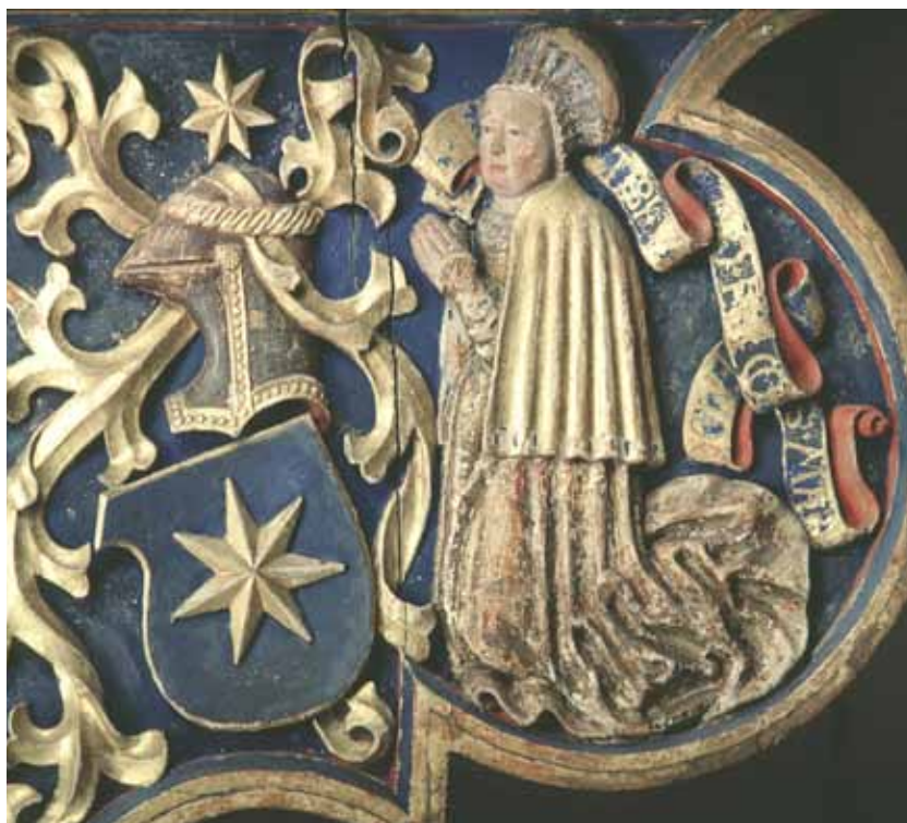
Kristina Gyllenstierna. Den äldsta bilden på henne är denna bildstod vid altaret i Västerås domkyrka. Kristina var gift med Sten Sture den yngre.

Lübeck var då en av Europas viktigaste och mest framgångsrika han-